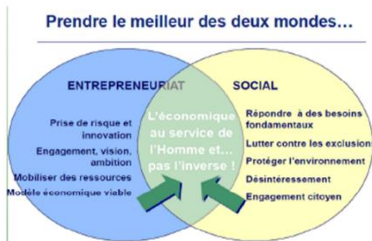
Figure 1 : L'entrepreneuriat social

. L'entrepreneuriat social combine entre l'entrepreneuriat classique et un modèle social, comme suit :