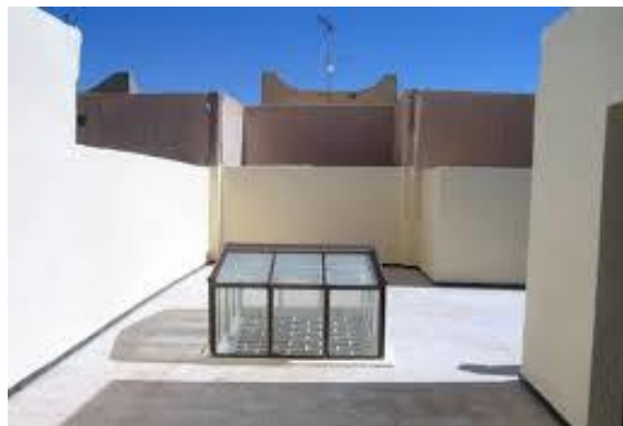
Figure 03 : indiquant l'ouverture aménagée au plafond

En effet, si dans la conception ancienne (annexe01), les ouvertures étaient réduites au maximum pour éviter la chaleur, tout en assurant l'essentiel de l'éclairage et de l'aération par une grande ouverture aménagée au plafond de la pièce centrale, dans la nouvelle conception, l'ouverture des fenêtres est plus large, même si tout le reste des référents architecturaux est maintenu.