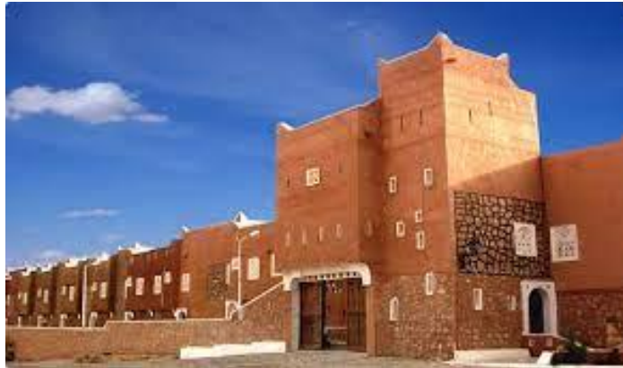
Figure 02 : de la cité Tafilalt

En effet, si dans la conception ancienne (annexe01), les ouvertures étaient réduites au maximum pour éviter la chaleur, tout en assurant l'essentiel de l'éclairage et de l'aération par une grande ouverture aménagée au plafond de la pièce centrale, dans la nouvelle conception, l'ouverture des fenêtres est plus large, même si tout le reste des référents architecturaux est maintenu.